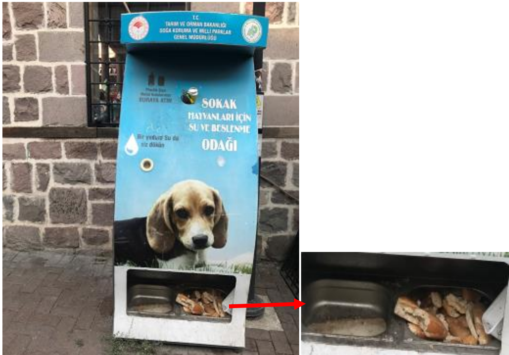
Ankara-Altındağ Hamamönü, Yorumsuz, mulasah

Tarım ve Orman Bakanlığı Doğa Koruma ve Milli Parklar Genel Müdürlüğü'nün, Sokaklara Koyduğu "Sokak Hayvanları için Su ve Beslenme Odağı"